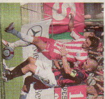
Una fase di Vis-Bologna